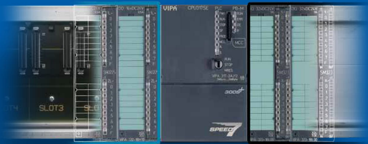
VIPA SPEED bus